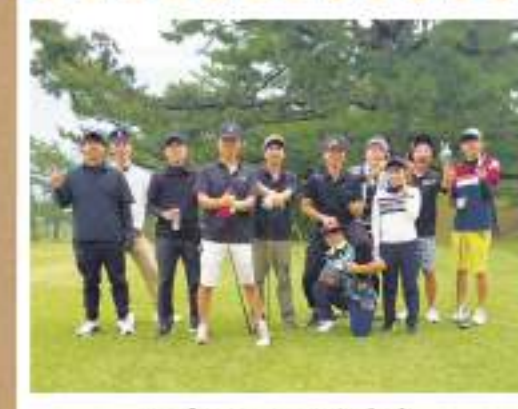
#プライベートも充実