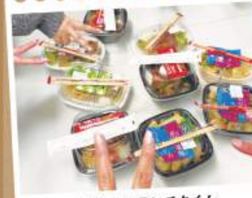
#みんなでランチタイム