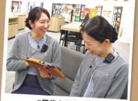
#研修中も楽しそう