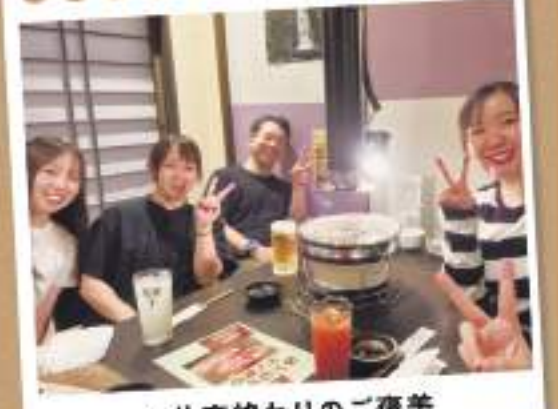
#仕事終わりのご褒美